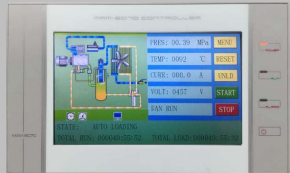
Pantalla HMI Táctil