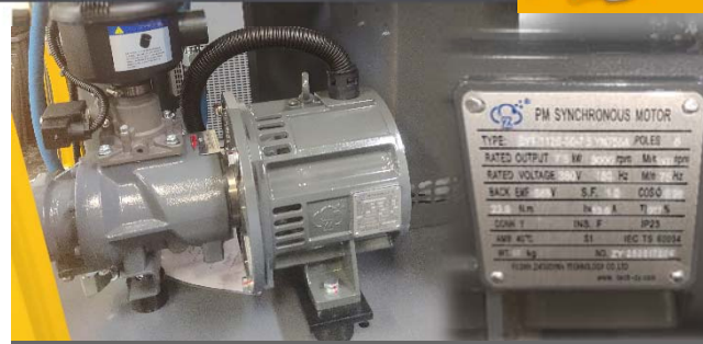
Motor Imán Permanente – Acople Directo